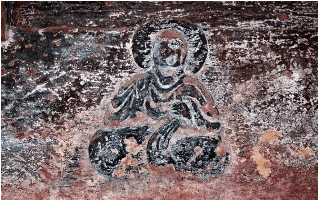
▲乐山市麻浩汉崖墓的坐佛像