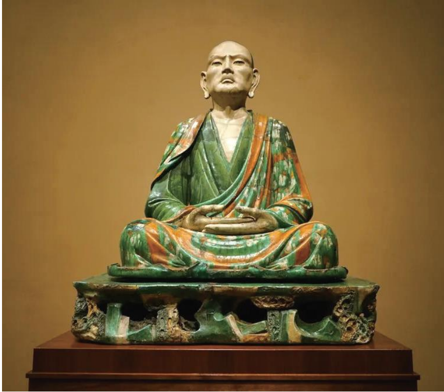
▲美国纳尔逊-阿特金斯博物馆藏易县阿罗汉像