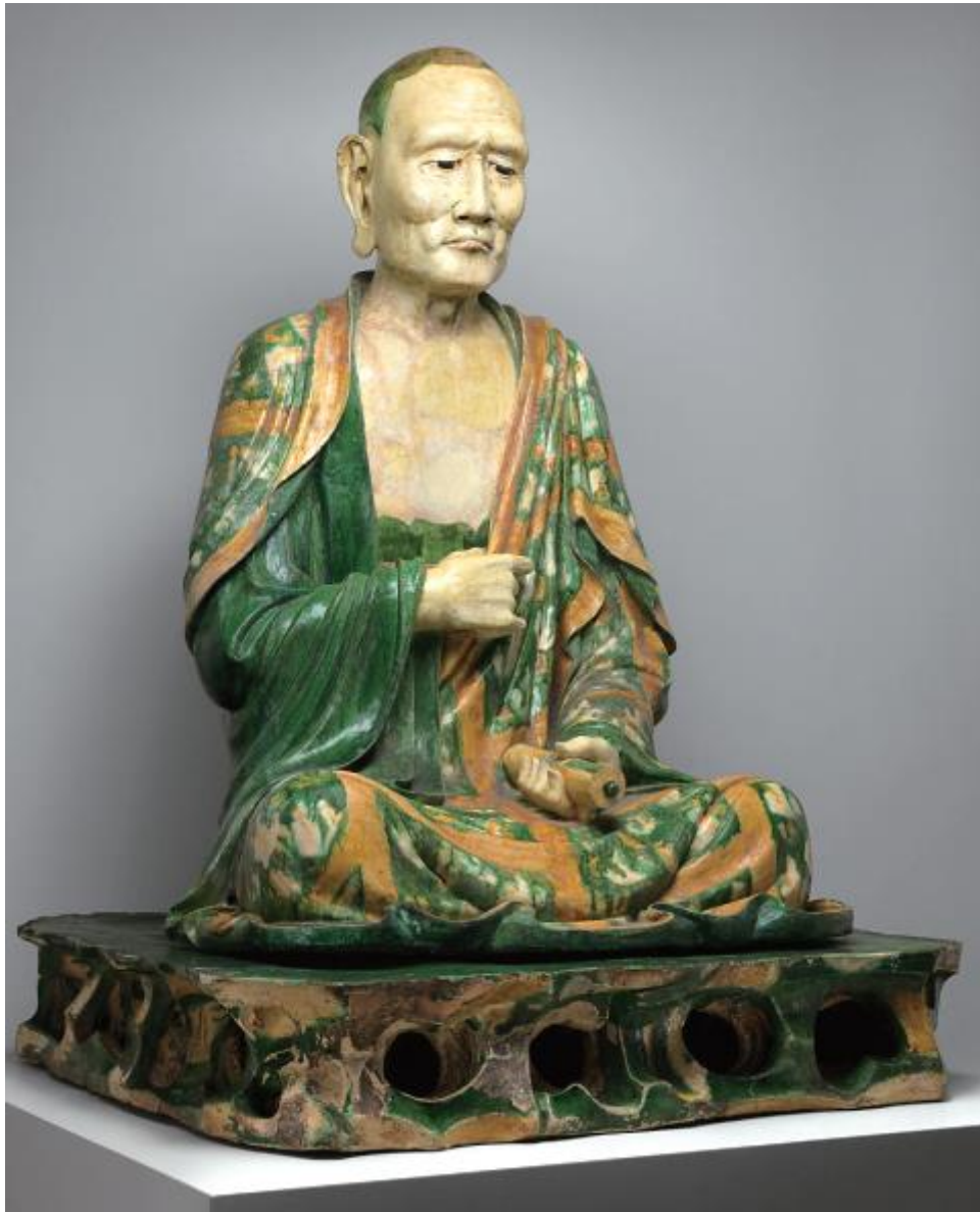
▲美国大都会博物馆藏易县阿罗汉像