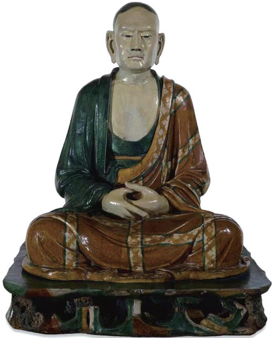
▲大英博物馆藏易县阿罗汉像