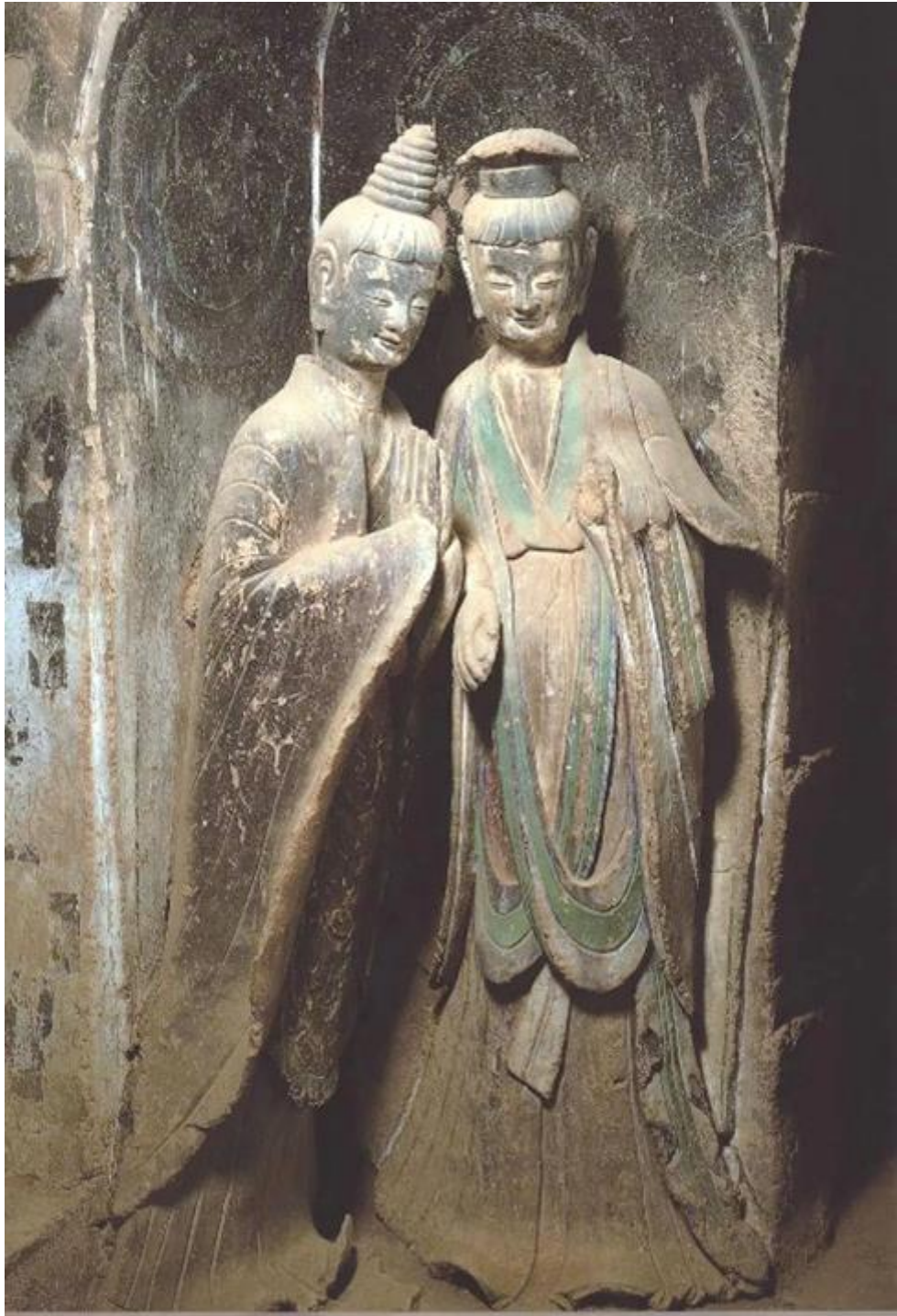
▲麦积山石窟第 121 窟菩萨和弟子像