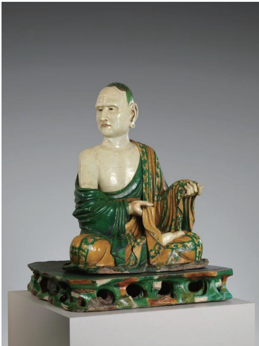
▲美国大都会博物馆藏易县阿罗汉像

神情深邃玄妙，仿佛是在体验甚深的道之本体，或是在体验寂灭之涅槃，并散发着彻见了真理的自信。