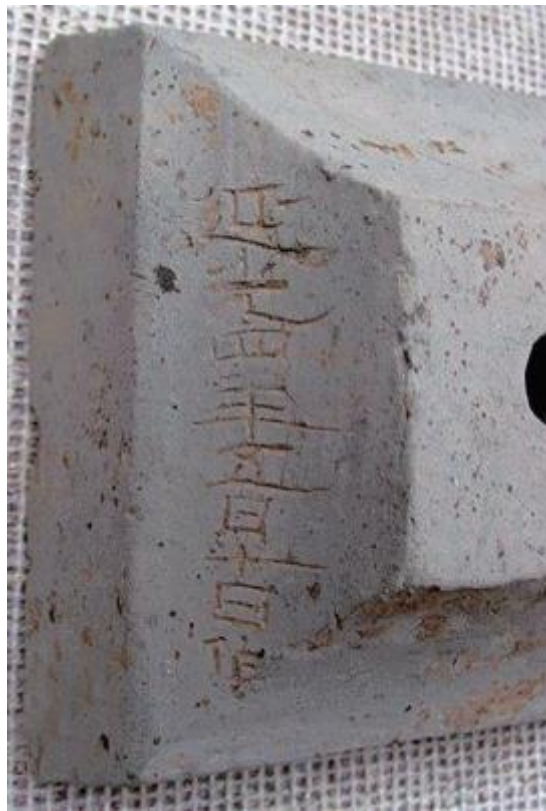
▲丰都镇江槽房沟第9号砖室墓出土的摇钱树