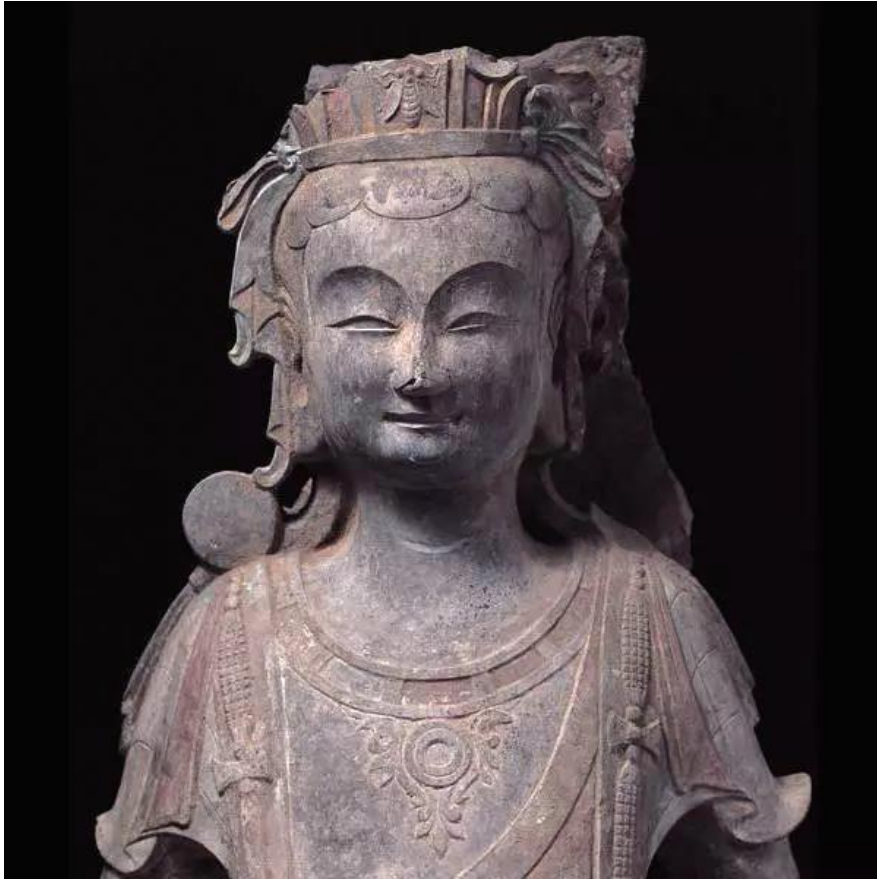
▲青州龙兴寺遗址出土的蝉冠菩萨像