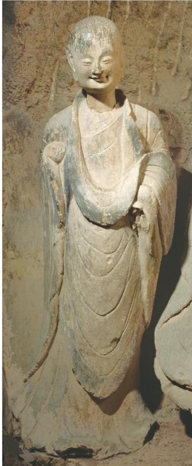
▲麦积山石窟第 133 窟第 9 龕小沙弥

麦积山石窟第 133 窟第 9 龕小沙弥，北魏时造，身高不足一米，孩童模样，袈裟略显宽大，头微微下低，可爱的脸庞略带稚气，清秀脱俗，细眯双眼，眉梢和嘴角都挂满了甜甜的微笑，令人忍俊不禁。