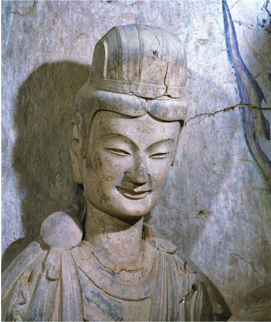
▲麦积山石窟第 127 窟北魏菩萨像

以上所讨论的麦积山石窟佛教人物造像都是面带着甜美而又清静无染的微笑，极为出彩，比肩西方蒙娜丽莎的微笑，被人们誉为“东方的微笑”。