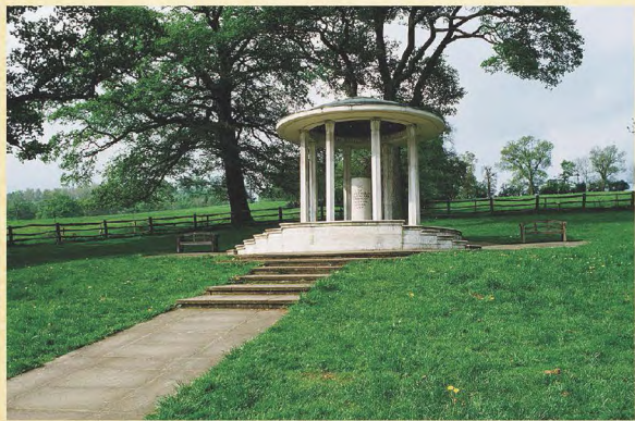
△ 竖立在兰尼米德的《大宪章》纪念碑，由美国律师协会出资修建，这是800年来《大宪章》影响深远的标志