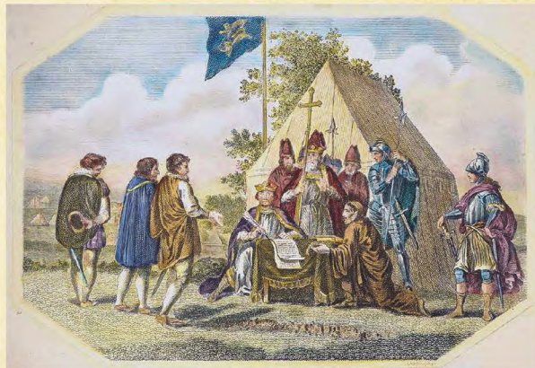
△ 18世纪的一幅板画，画中的约翰正在签署《大宪章》，地点是兰尼米德，大主教兰顿等人在一旁见证